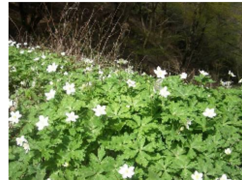
登山道脇のニリンソウの群落

＜記録＞8:00 JR相模湖駅集合 8:25 出発→10:45 明王峠→11:40 陣馬山着 12:55 出発→14:10 陣馬高原下バス停着→15:10 高尾駅着解散